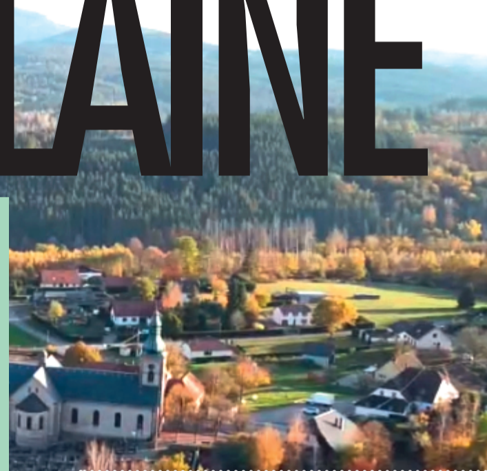
Maire de Plaine